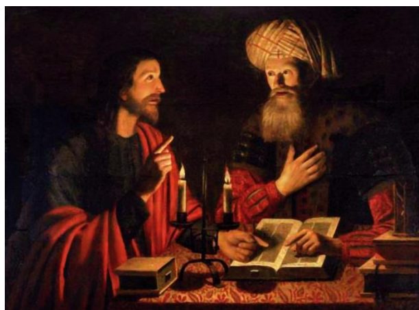
«Ночной разговор Иисуса и Никодима». Картина Крейна Хендрикса

Утрата единства сего породила стремление людей вернуть его, с тем — и науку исканий, л ин гвистику. Сильной стать ей — есть родиться в|то|рич но: от Слова, Начала. Лингвистика Мира — сакральная, труд мой, — наука земная, рожденная свыше. То — Знание, стяжавшее Силу: Ум — Сердце, Исток. Им сильны, обретем мы Себя .