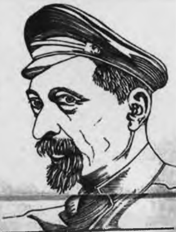
Председатель ВЧК—ОГПУ тов. Ф. Э. Дзержинский