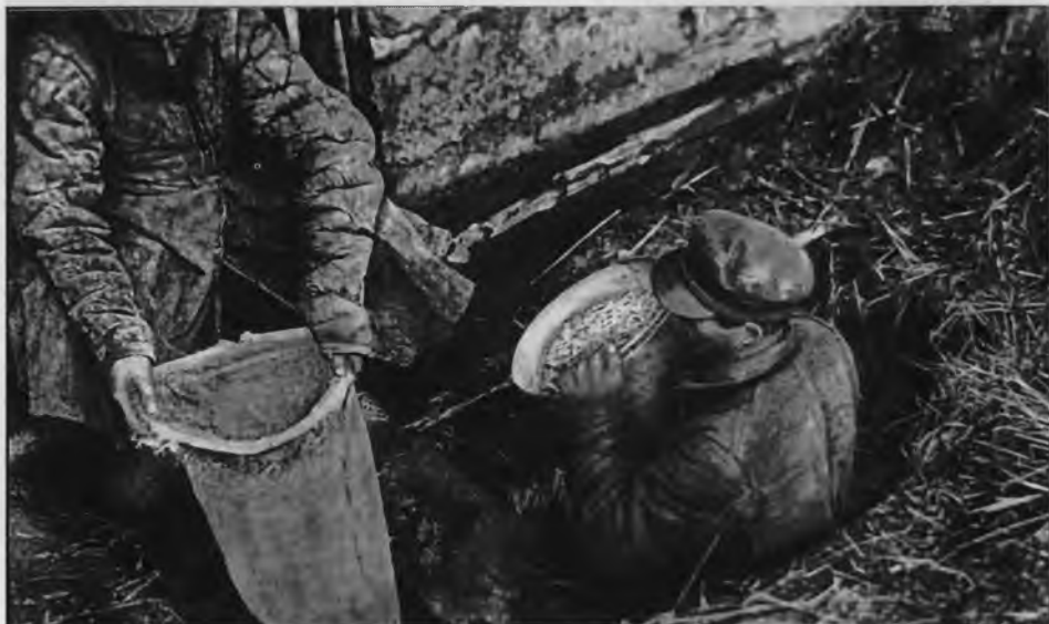
Работники ГПУ отбирают хлеб у крестьян.

Записка Т.Д. Дерибаса секретарю ЦК РКП(б) В.М. Молотову от 28 октября 1925 г.