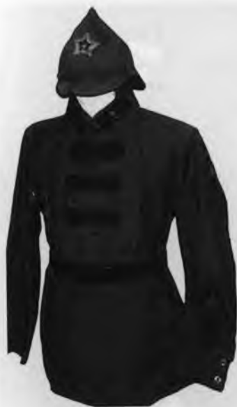
Форма работников ОГПУ.