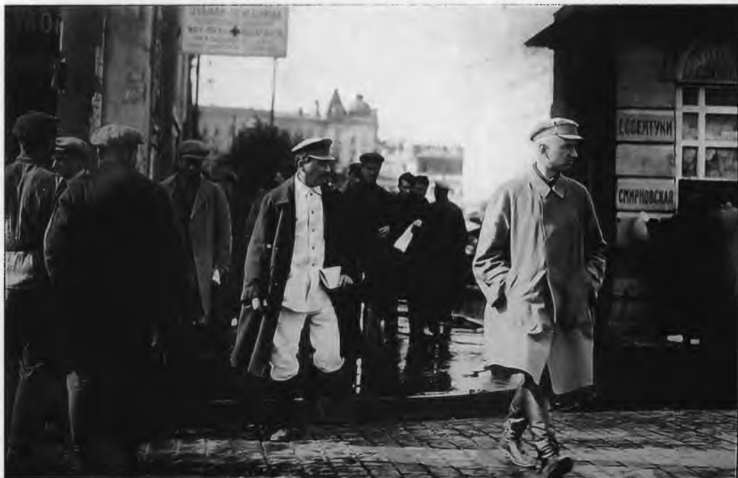
Сталин в сопровождении сотрудника ОГПУ. (конец 1920-х гг.)