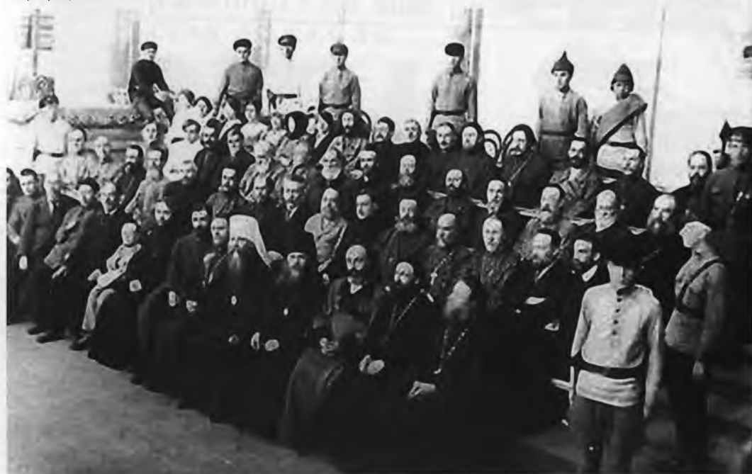
Судебный процесс по делу об изъятии церковных ценностей. Подсудимые священники в зале суда. Петроград. Май 1922 г.